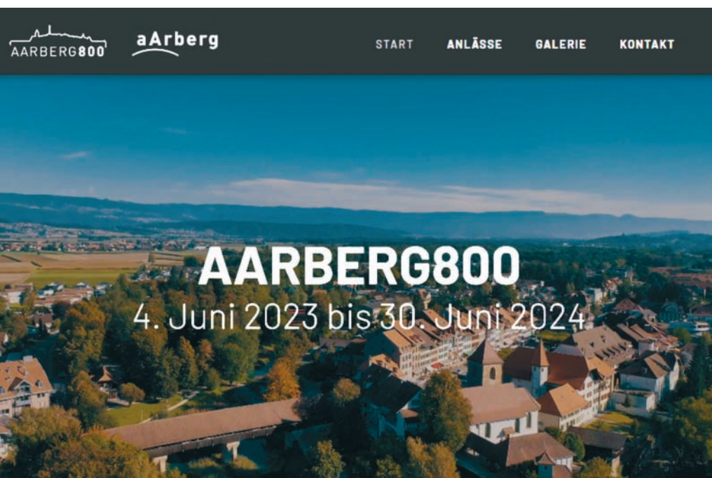
Die Startseite des AARBERG800-Webauftritts