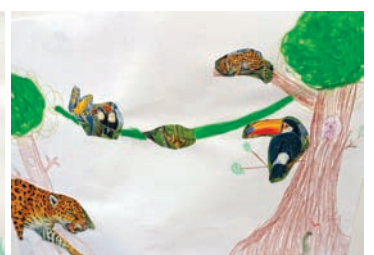
Ferienpass 2021: Wettbewerbsbeiträge unserer erfolgreichen Adventure-Raum Bezwingler*innen.